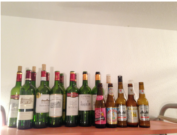
写真1 棚上の空き瓶