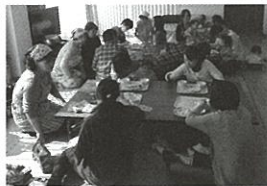
「子育て支援活動の表彰」 厚生労働大臣賞受賞

沖縄は国内でも独特の文化を持つ地域で季節感も違います。 フリーペーパー「たいようのえくぼ」は、そんな沖縄で子育てする うえで知っておきたい情報を、沖縄に住むママたち自身が収集し 紹介しています。沖縄県内でもさらに子育て事情の異なる 離島版の発行を目標に活動しています。