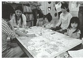
「子育て支援活動の表彰」 文部科学大臣賞受賞